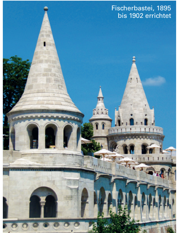
Fischerbastei, 1895 bis 1902 errichtet