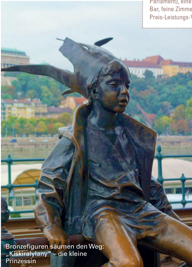
Bronzefiguren säumen den Weg: „Kiskirálylány“ – die kleine Prinzessin