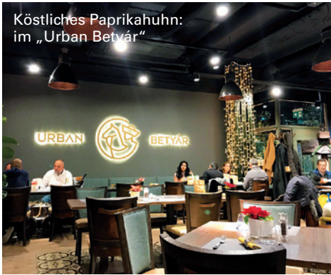
Köstliches Paprikahuhn: im „Urban Betyár“