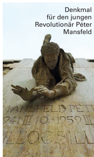
Denkmal für den jungen Revolutionär Páter Mansfeld