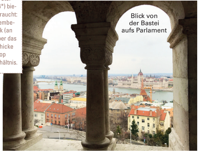
Blick von der Bastei aufs Parlament