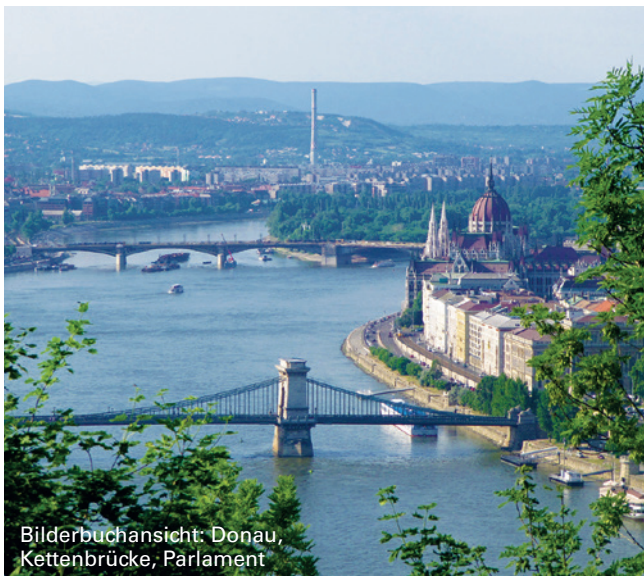
Bilderbuchansicht: Donau, Kettenbrücke, Parlament