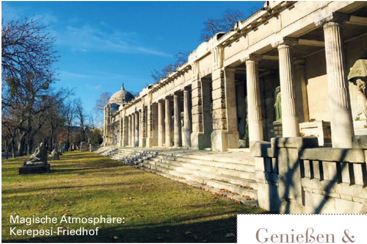
Magische Atmosphäre: Kerepesi-Friedhof