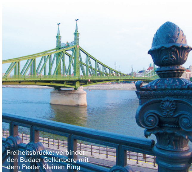
Freiheitsbrücke: verbindet den Budaer Gellértberg mit dem Pester Kleinen Ring